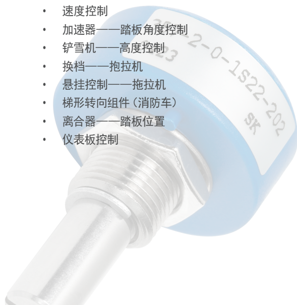
高精度电位计/霍尔效应传感器